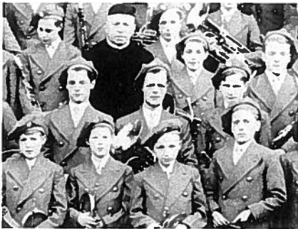
Giften werden gebruikt voor vrijetijdsbesteding zoals muziek maken. De harmonie Ons Genoegen van Huize Nazareth was een middel tot ontspanning, maar ook om sympathie bij de bevolking te winnen.