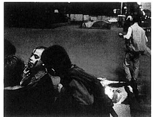
ZorgSaam deed een kerstgift ten behoeven van zwerfkinderen in Moskou.