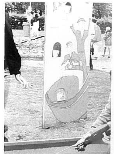
Jaarlijks is er op het terrein van Kompaan in Goirle een feestdag voor de jeugd. ZorgSaam doet regelmatig een duit in het zakje om van deze dag een succes te maken.

Met financiële ondersteuning van activiteiten wil ZorgSaam voor Jeugd hulp geven aan jeugd in de knel. Daarbij ligt een sterke nadruk op de regio Midden-Brabant en worden vooral innovatieve projecten ondersteund. Er is bijzondere aandacht voor projecten die worden voorgedragen door Stichting Kompaan of Bureau Jeugdzorg. De financiële hulp kan nieuwe vormen van begeleiding betreffen, maar ook rechtstreeks de leefsituatie van jeugdigen en hun ouders of verzorgers. De instellingen blijven zelf verantwoordelijk voor hun exploitatiekosten.