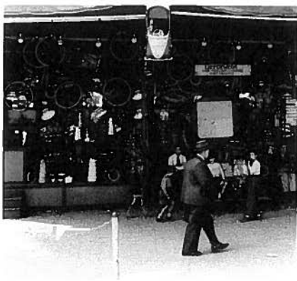
Een deel van de opbrengst van deze kermiskraam was bestemd voor het Liefdewerk voor Kinderbescherming Huize Nazareth.